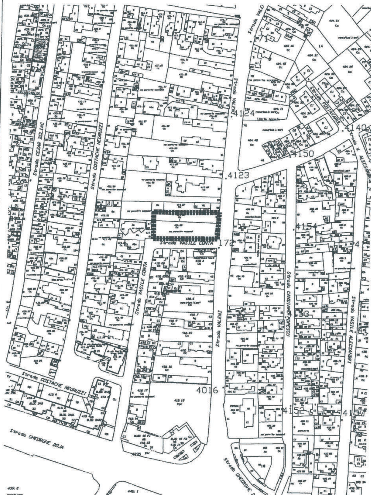
PLAN DE INCADRARE sc 1:2000